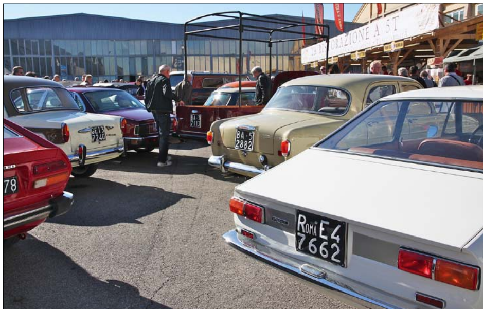
Myös ulkoalueella hallien keskellä riitti nähtävää

talojen välissä luikertelevat kanaalit. Ka-pea maakannas yhdistää Venetsian mantee-reeseen ja ainoastaan sitä pitkin kaupungin luoteisreunalle pääsee junalla, bussilla tai henkilöautolla. Tulopäivänä ehdimme jo vähän tutkia saarten päälle osittain puupaalujen varaan rakennettua kaupunkia ennen kuin siirryimme seurueen kanssa yhteiselle illalliselle.