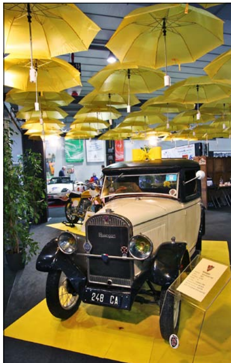
Rosengart LR 2 vuodelta 1927

Perjantaiamuna lähdimme aurinkoisessa säässä taxiveneellä rautatieasemalle, josta matka jatkui Pendolino-junalla kohti messuja. Padovan asemalle oli vain noin 40 kilometrin matka, ja pian olimmekin jo perillä. Pienen kävelyn jälkeen alkoi selvitä että tapahtuma on valtava ja nähtävää on paljon. Messuilla oli 11 isoa hallia 9 hehtaarin alueella kaikki pihatkin kalustoa täynnä; järjestäjän mukaan paikalla on 4000 autoa ja moottoripyörää. Saksan näyttelyistä poiketen raskaampaa kalustoa tai työkoneita ei ollut ollenkaan nähtävänä.