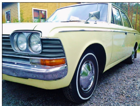
Kauniin keltainen Toyota Crown RS50 vuodelta 1969.

Auto on aito Suomi-auto. Sen osti uutena everstiluutnantti evp. Markus Palo-