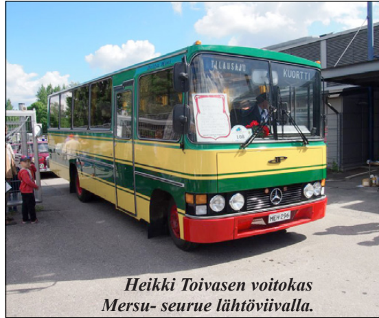
Heikki Toivasen voitokas Mersu- seurue lähtöviivalla.