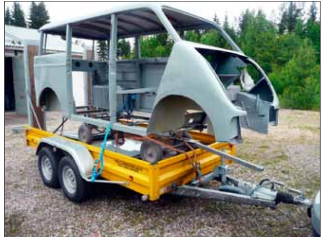
15.6.2010 Donauta on tuotu maalaamolta

Museoajoneuvotarkastajat ovat tehneet katselmuksen ja antaneet positiivisen lausunnon, museoajoneuvotodistus saatiin.