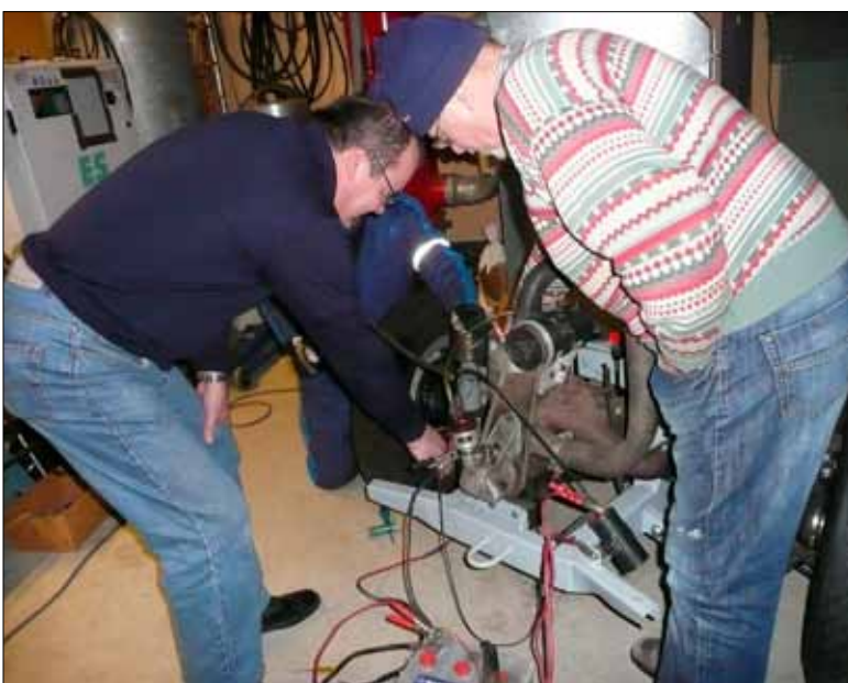
16.12.2010 ollaan ottamassa ensimmäisiä savuja.