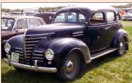
Plymouth Roadking 4-door Sedan 1939