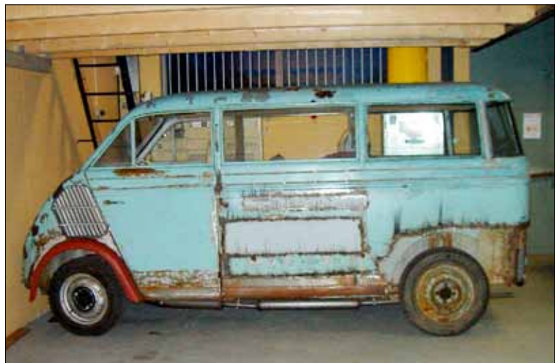
3.11.2003 alkumetreillä Donau näytti tällaiselta.