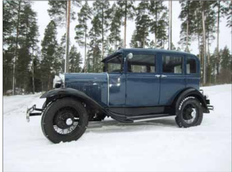
A-Ford vuodelta 1930 Keski-Suomen lumilla 2014.

Jäestyksessään 41. talviajot ajeltiin Saarijärven alueilla. Noin 220 autokuntaa osallistui tähän tapahtumaan, joten ajojen suosio on korkealla. Silti tästä kerrasta voisi sanoa, että yksi ratkaisevassa roolissa oleva ”taho” eli talvi ja erityisesti lumi olivat poissa. Suosikkiosioni eli jäärata ajoissa kuitenkin oli, kiitos ennen ajoja olleen pakkasjakson. Viime vuoden ”tittelin” uusiminen, olla nopein nastarenkaaton auto, ei A-Fordilla onnistunut, vaikka parhaani yritin. Aikoja katsoessani tuntui, että ei riittäisi edes se tunnettu lause, jos sais vielä kerran yrittää... Naureskellen totean, että mieltä lohduttavaa on uskoa hitauden syyksi ne kaikki A Fordin 40 heppaa, vanhoja kaakkeja kun ovat!! Siitä huolimatta uskon, että taas ensi talvena uudestaan keski-Suomeen kokemaan talven riemut. Sinänsä ajot sujuivat ihan kivasti ja järjestelyt toimivat hyvin. Yksi hyvinkin jännittävä muutaman sekunnin pituinen tilannekin tuli koettua, siis oikeat kauhusekunnit. Kun itse kesärenkain ajaen sain ketjuilla varustetun ja hitaasti liikkuvan T-Fordin kiinni, niin eteen tuleva tilanne yllätti. Yllättäin ylämäki muuttuikin jyrkäksi ja kun tuossa tilanteessa olisi pitänyt odottaa, että tie on auki ja ottaa kova vauhti mäkeen. Nyt jouduinkin tuossa hetkessä vain toteamaan kyytiläisilleni, että jos nyt takapyörä kerrankin pyörähtää tyhjää, niin meidän kulkusuunta vaihtuu peruuttamiseksi. Kun tien pinta oli jäinen, lunta vain noin 5-10cm ja tietä reunustivat