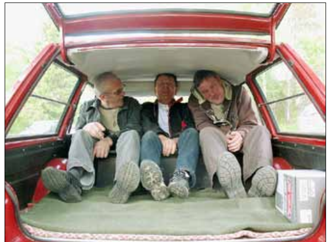
Kuvavissa koeistutetaan pykälien mukaisesti hyväksytyä Mazdan piilofarmarin takapenkkiä.