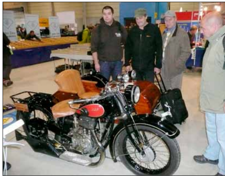
Tämä NSU 501 TS vm 1930 maksoi 18350 euroa.

Kaksipyöräisiä, varsinkin mopoja, kaikenkuntoisia, olisi saanut edullisesti.