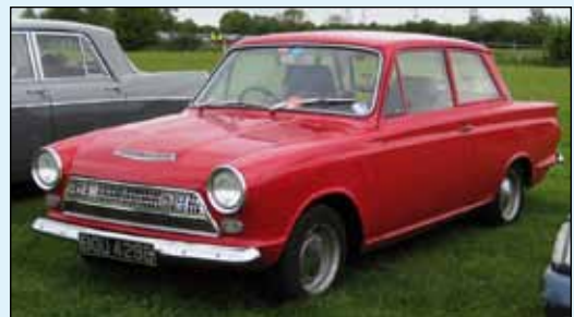
Ford Cortina Mark I