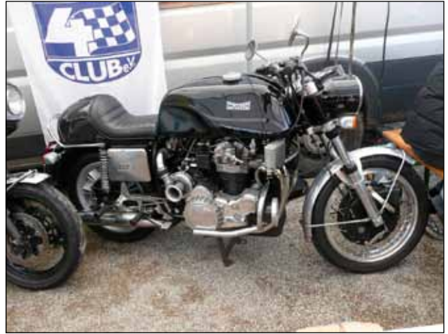
Aikansa suurin tehopyörä Münch Club oli osastollaan Veteramassa.

puksi loppui kokonaan. Kaikki tämä tapahtui kaupunkialueella ja n. 50 metrin päässä markkinayleisön paluureitiltä. Tämän jos tekisi Suomessa niin aika äkkiä joutuisi ammuskelusta pidätetyksi.