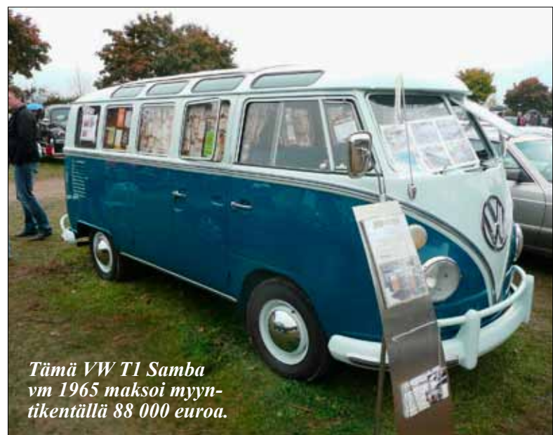
Tämä VW T1 Samba vm 1965 maksoi myynti- tikentällä 88 000 euroa.

Markkinoilta pois lähtiessä nähtiin myös erikoinen kanin metsästysnäytös. Kolme haulikkomiehistä, pari ajomiestä ja iso vihreä John Deere niminen ajokoiraa kaneja metsästävä. Näin se käy, John Deeren pui pientä maissipellon tilkkua ja haulikkomiehet vahti ja ampui ympärillä laihosta pakenevia kaneja. Saalistakin tuli sitä mukaa kun pystyssä oleva laiho pieneni ja lo-