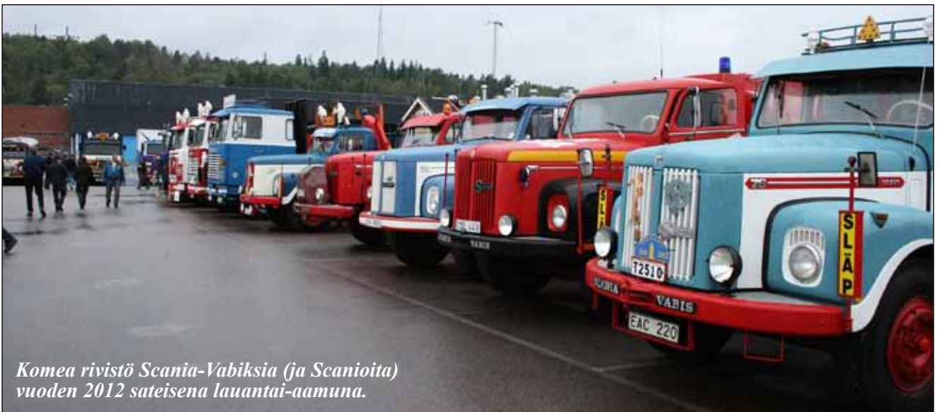
Komea rivistö Scania-Vabiksia (ja Scanioita) vuoden 2012 sateisena lauantai-aamuna.