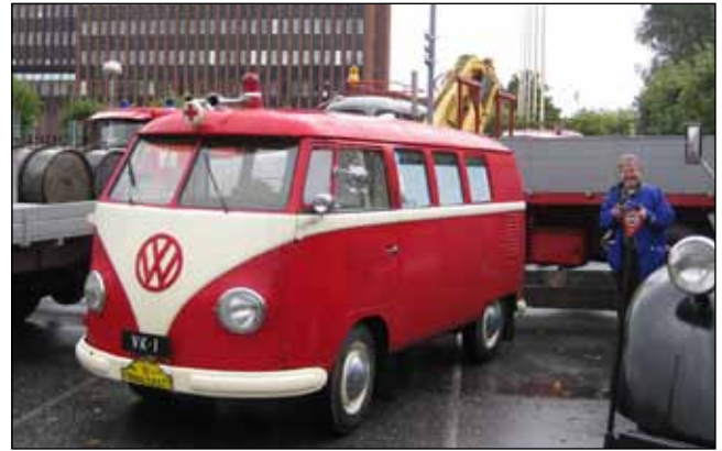
Kjell Törngvistin VW Typ2/27 Ambulanssi.