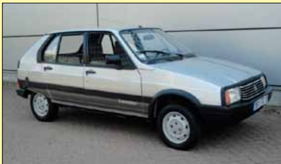
Citroën Visasta oli myös Diesel versio