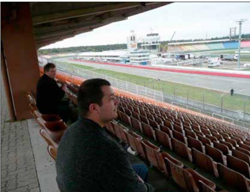
Hockenheim Ring oli hiljainen