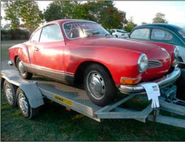
Tälläinen Karman maksoi myyntikentällä 3500 euroa