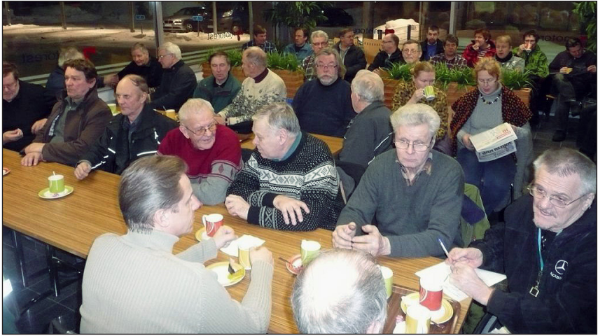
Vuosikokous 2011 Karistossa