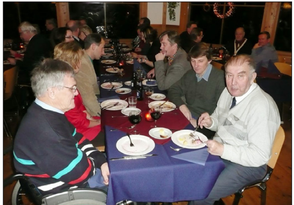
Pikkujoululeisöä oli paikalla noin 80 henkeä.