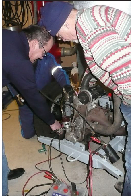
Donaun moottori käy!

Belarush, David-Brown, Farmall, Ferguson, Ford, Fordson, Hanomag, Massey-Ferguson, Porsche, Takra, Valmet, Volvo, Zetor