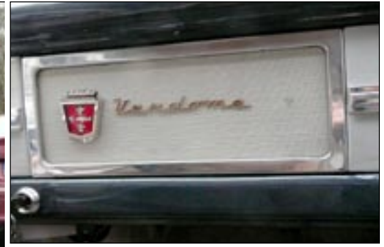
Hanskalokero on näin kauniisti koristeltu. Kelpaa siinä rouvan puutereita lokerosta kaivella.