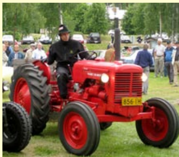
Eräs tuhansista Valmet traktoreista esittäytyi viime kesänä Vääksyn mobilisti-tapahtumassa.