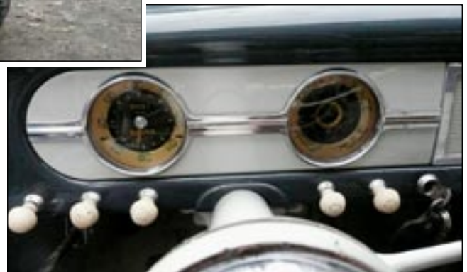
Mittaristo kyllä näyttää aika vaatimattomalta näinkin isoon ja hienoon autoon, oikeassa keskiössä on hyvänäköisiä varten pienempien kellokin.