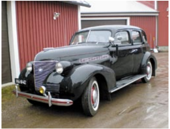
Muutammat rohkeat autoharrastajat olivat saapuneet paikalle harrasteajoneuvoilla.

Automuseolla vieraili monenlaisia autoharrastajia; moni tuli ihaillemaan vanhojen autojen kauneutta, hakemaan nostalgiaa tai tapaamaan uusia ja vanhoja tuttavuuksia, mutta vierailijoiden joukkoon mahtui myös autojen entisiä omistajia muistelemassa menneitä kilometrejä ja tapahtumia vuosien varrelta.