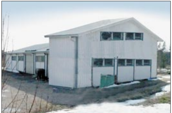
Työryhmän keskusteluista vapaasti taiteiltu näkemys hallin laajennuksesta