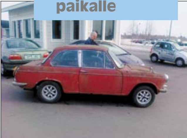
Suomessa on kaikenlaisia autoja. Daihatsu Malli COMPAGNO 1000 Sedan (AA) 2ov 950cm3 Vuosimalli 1968.