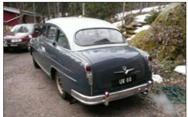
Näin uljaalta näyttää Vendome takavinkkelistä.