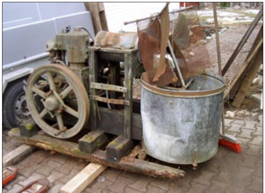
Pihalla odotteleva Vaasassa valmistettu hyväkuntoinen Wikström-aiho.