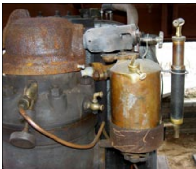
Porilaisen dieselin kuulasytytys. Puhalluslamppu asemassa, kuuma, lähes näkymätön sininen liekki lämmittää valurautaisen tuulen suojan sisällä olevaa sylinterin yläpään kuulaa.

toinen tai pumpulla. Voitelua toteutetaan roiskevoiteluna, öljyntiputtimella ja isommissa oikein paineistettulla keskusvoitelujärjestelmällä. Kaasarit ovat hienoja messingistä valettuja taideteoksia. Joskus pula-aikaan moottorin tilaajalla piti olla toimittaa omat messingit moottoria tilattaessa. Puhalluslampun sytytys tapahtuu sprillä ja varsinainen polttoaine on lampuöljy.