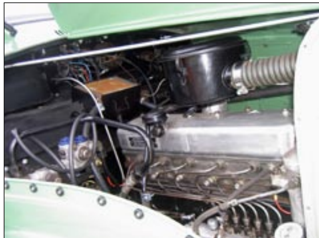
Konehuoneessa komeilee kuusipytyistä tekniikkaa.