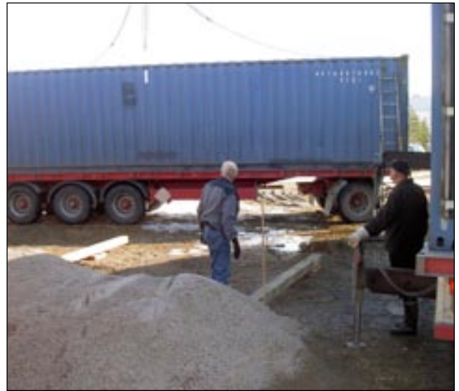
Kalle ja Pepe tarkkailemassa uuden varasto laske- mista perustuksille.

1.4.2009 hallin tontille ollaan toimittamassa lisää tilaa, uusi kontti nostossa.