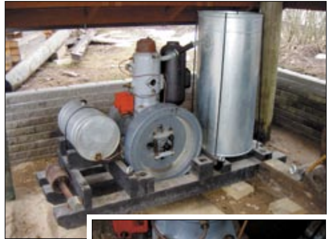
Porilainen 8-10 hv 2- tahti diesel.

eivät minulle oikein auenneet, Porilaisia kumminkin. Toinen Porilainen on 8-10 hv ja isompi 10-12 hv, näitä maamoottorin kokoja on kuvattu hevosvoimilla. Vuosimallit lienevät 20-30 luvulta.