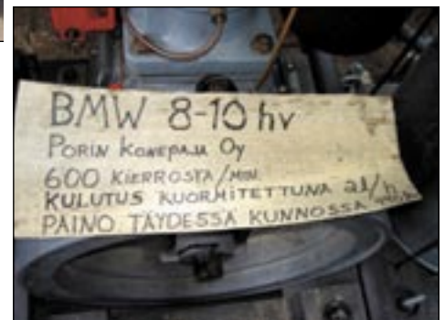
Porilaisen tärkeät faktat.