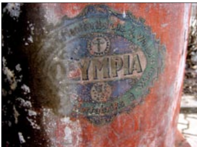
Hienossa tuotteessa on pitänyt olla hieno tuotemerkki, maalaus on jo vähän kauhtunut.