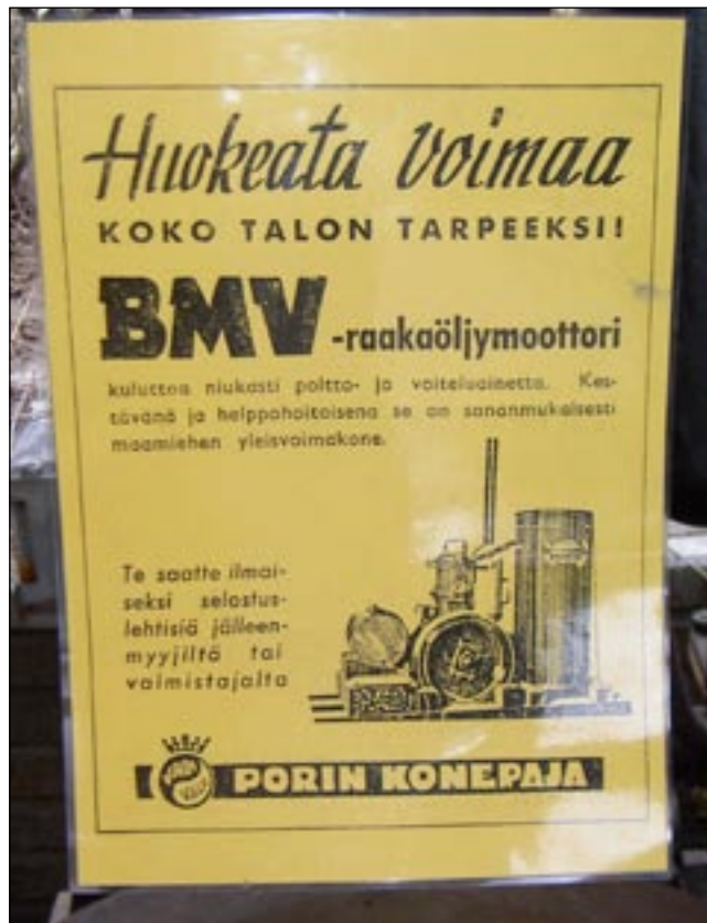
On niitä myyninedistämistoimia osattu tehdä ennenkin.

Harrastajat syytävät tietoa moottoreista. Tämän on leilimoottorimalli. Mikä se on? No sen polttoainesäiliö on leilin muotoinen. Dieselissä on kuulasytytys. Ei se kyllä ollutkaan kuulun muotoinen, vaan paremminkin puolipallon muotoinen sylinterin yläpää jota lämmitetään puhalluslampulla hehkuvaksi ennen käynnistystä. Diesel polttoaine ei oikein muuten syty puristuksessa. Lisäksi siinä pitää olla tuulensuoja, valuraudasta huppu päällä, ettei tuulet pääse jäädyttämään. Kierroksien säätö / vakiointi tapahtuu vauhtipyörän keskiössä olevan jousikuormitteisen keskipakoissäätäjän avulla. Dieselin kierroksia säädetään polttoaineen syötön määrällä ja bensakoneen kierroksia ihan perinteisesti imukanavan kaasuläpällä. Bensakone tarvitsee magneeton ja tulpan. Jäähdytys on vesilauhdetteinen, vapaakier-