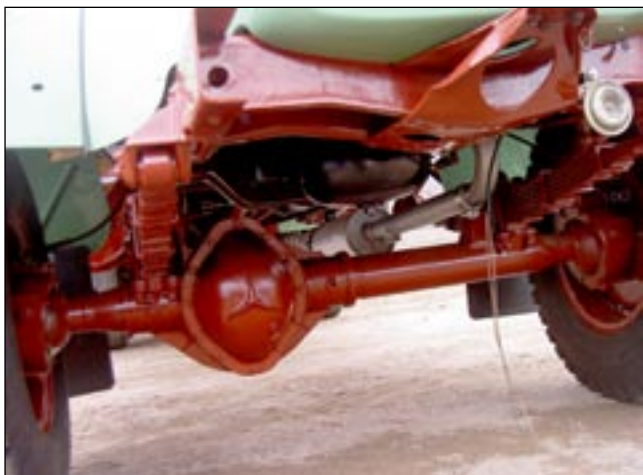
Näin on järeän näköinen tämä etupää 4x4:stä.