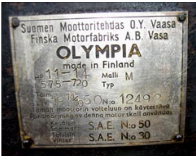
Suomen Moottoritehtaan valmistajan kyltti on säilynyt hyvin ja kertoo kaiken oleellisen.

Olympiat taas on valmistettu Vaasassa. Isompi, hyväkuntoisen näköinen Olympia on 11-14 hevosvoimainen 1950 mallinen ja pienempi oli 5-6 hevosvoimainen ehkä v. 1930.