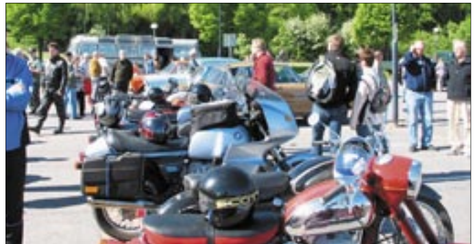
Kuvia viime kesän vastaavasta retkeilypäivästä. Yllä moottoripyörä lähtötunnelmissa, alla kerhon ”Petteri” Hollolan kirkolla.

Etappipaikoille koitetaan järjestää ennakoilmoittelua, saadaksemme yleisöä ja julkisuutta.