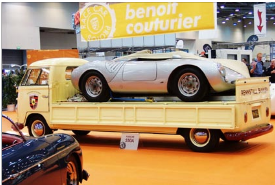
Volkswagen jatketulla akselivälillä. Lavalla Porsche 550A urheiluauto. Viimeisen päälle laitetuista ajoneuvoista.

Kahdella piha-alueella oli yksityisten harrastajien ajoneuvoja myynnissä. Hinnat olivat suomalaisittain kalliimman puoleisia. Muutenkin sisällä halleissa olevista entisöintifirmojen ajoneuvoista suurin osa oli myytävänä, hinnat olivat järkyttäviä!