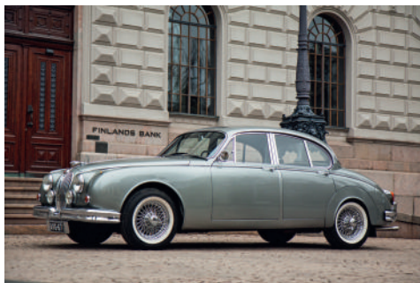
Mk2 vm 1966 1. om Väisälä Oy

lisäksi aikakaudella muutama muuttoauto. Autojen historia on tiedoissa, valtaosa autoista on säilynyt.