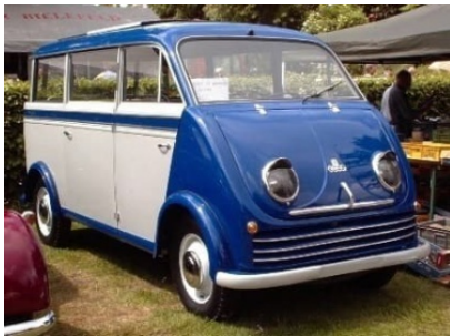
DKW Schnellaster F 89 L minibus, 1954

Tätä DKW:tä valmistettiin vuosina 1949-1954 myös avolavana ja suljet- tuna pakettiautona. 2-sylinterinen kaksitahtimoottori, 688 / 792 cm 3 , tuotti 22 / 30 hp, vesijäähdytteinen.