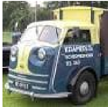
Tempo Matador 1950

Tämä on yksi niistä harvoista 40 – 60 -luvulla toimineista autovalmistajis- ta, joka säilyi itsenäisenä. Monia muita kohtasi joko fuusio tai kon- kurssi.