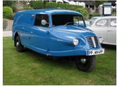
Goliath Goli Kastenwagen

Sekä Goliath 400 ssa että Goliath Goli Kastenwagenissa oli 2-sylinterinen, 493 cm 3 , 2-tahtinen