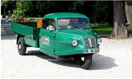
Borgward Goliath Goli