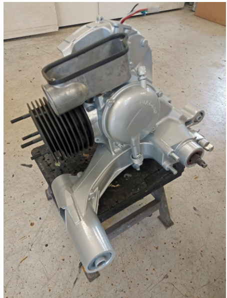
Moottori alkaa olemaan koettelemusten jälkeen kasassa, pvm. 07.06.2024

Pitkähkö projekti, kaikkine kokemuksineen, on tehokkaasti laskenut Vespakuumettani lähes alilämmön puolelle. Etenkin ne edellisessä Vellamobiili -julkaisussa kertamani onnettomuus ja samalla virheettömänä uskomani, Päijät-Hämeestä minulle myyty, Vespa on ollut sen verran rajua kokemus, että Vespakuume ei hevillä nouse uudelleen 42 asteeseen. Hyvä niin...