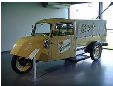
Goliath 400 kutsuttiin myös Tempo

Borgward innostui pienkuorma-autoista ja perusti autotehtaan Bremeniin nimenomaan näiden pienkuorma-autojen tuotantoa varten.