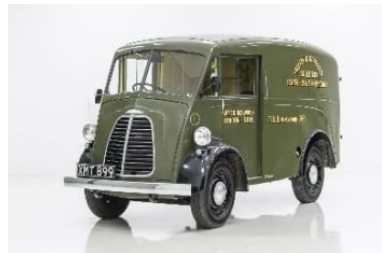
Morris J1950 -luku

..... Teksti Juhani Lahtinen 14.04.2024 Lähde Eri kv. lähteet