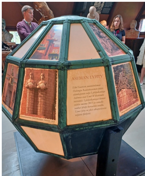
Emil Vikström oli veistänyt Helsingin rautatieaseman kivimieshahmot ja yksi alkuperäinen lyhty oli ateljeessa näytillä.

Seuraava ja viimeinen ajo-osuus olikin sitten Visavuorelta päätepiiteeseen Rönnvikin viinitilalle. Olimme hieman aikataulusta jäljessä ja meidät ohjattiinkin suoraan lounaspöytään. Maittavan lounaan jälkeen oli palkintojen jako eli mm. parhaan asuajoneuvonpalkinto, jota kaikki osallistujat saivat äänestää. Virallisen osuuden jälkeen tehtiin ostoksia tilan viinikaupasta ja kierrettiin vielä hieno luontovalokuvanäyttely ja sitten kotimatkalle. Oikein hyvät ajot eli mukavat kohteet, upeita asuajoneuvoyhdistelmiä ja leppoisa tunnelma, ensi vuonna taas!