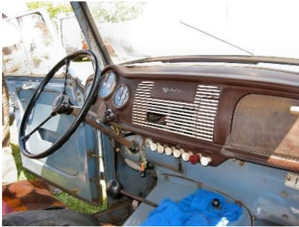
Borgward Goliath Goli ohjaamo

Goliath Golin ohjaamo oli enempi nykypäiväisen näköinen, oli nappuloita.