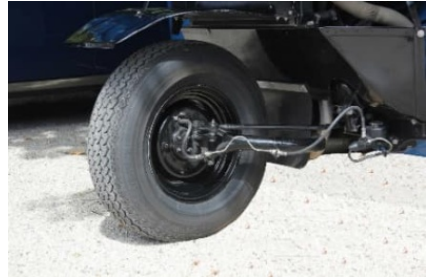
Borgward Goliath Goli etupyöparipustus

C Borgwardin ylpeys pienkuorma-autopuolella oli tämä Goliath Goli avolava . (kuva vasemmalla ) Sen ketteryyys ja helppokäyttöisyys olivat vailla vertaa. Takavetoisena sillä oli pieni kääntösäde ja sen matalalle lavalle oli helppo lastata. Tuolloinhan enimmät lastaukset tehtiin käsin ilman koneita. Tätä autoa valmistettiin vuosina 1955 – 1961 vain 9904 kpl.