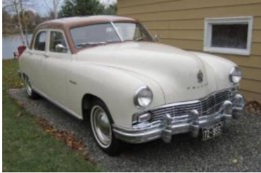
Kaiser Manhattan vm 1946