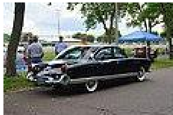
Kaiser Manhattan, kromilla ”kirkastettu” versio, vm 1955

Joseph W. Frazer., johtaja jolla oli jalat maassa, vetäytyi kuitenkin pois yrityksestä v 1953 ja yhtiön nimeksi vaihdettiin Kaiser Motors .