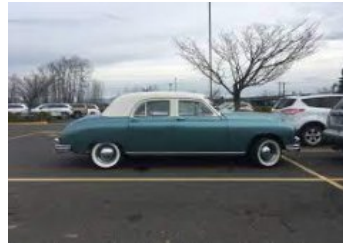
Kaiser Manhattan vm 1948

Tuona aikana ei puhuttu autoilun taloudellisuudesta. Tämäkin auto on varustettu bensamootorilla. Pituutta autolla on 5,4 m ja painoa yli 2 000 kg . 115 hv:n moottori huolehtii sekä vauhdista että myös polttoaineen kulutuksesta. Kaikissa suurissa jenkeissä oli tavoitteena V 8, mutta tähän autoon oli saatavana vain suora 5,75 l, 6-kone .