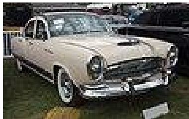
Kaiser Manhattan, ahdettu moottori, vm 1954