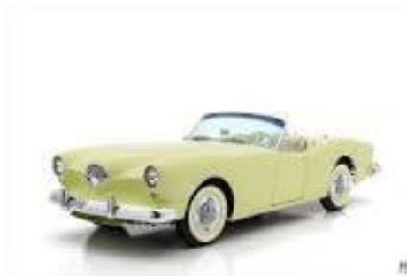
Kaiser Darrin DKF 161 vm 1953

että uusi v 1953 lanseerattu malli Kaiser Darrin DKF-161 toisi pelastuksen urheiluautojen kautta. Tämä malli syvensi entisestään tehtaan ongelmia, autoa valmistettiin vain 435 kpl. Samanaikaisesti tehdas suunnitelti ja toi markkinoille v 1954 uuden mekaanisella ahtimella varustetun Kaiser Manhattan (kuva alla vasemmalla) mallin ja vuonna 1955 lippulaivansa, toisen Kaiser Manhattan mallin – mustan auton, jossa loisti jenkkipromi (kuva alla oikealla)