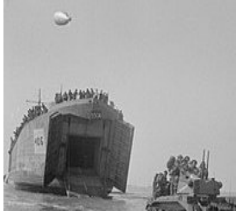
Kuva Normandian maihinnoususta 1944

Henry J Kaiser ´in omistama ShipbuildingCompany satsasi 1930 -luvulla voimakkaasti laivanrakennusteollisuuteen. Yhtiö specialisoitui valmistamaan ns Liberty ja LST -aluksia. Nämä olivat II maailman sodassa käyttökelpoisia pienaluksia, jolla pystyttiin kuljettamaan sekä sotilaita että sotakalustoa meriteitse suoraan satamattomaan rantaan. Liiketoiminta oli menestyksestä aina 40- luvun puoliväliin saakka.