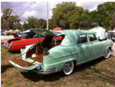
Kaiser Vagabond vm 1951

Näin massiivinen auto oli ilmeisen helposti muutettavissa kysynnän mukaan. Niinpä v 1951 Kaiser -Frazer toi markkinoille sarjavalmistetun Kaiser Vagabond -version .