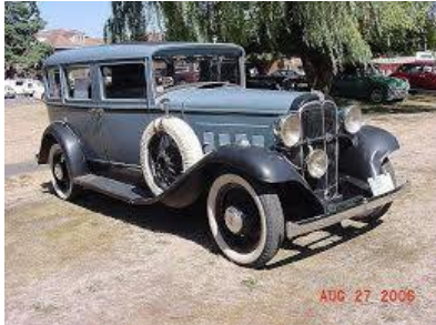
Willys 8-80 D

Willys oli kuitenkin vanha merkki. Se oli valmistanut henkilöautoja jo 1908 lähtien, joskin vaatimattomassa määrin. Tuolloin oli pääpaino henkilöautoissa.