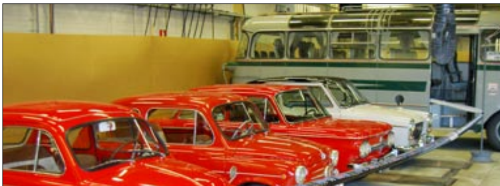
Komea rivistö kuuskyltuluvun pikkuautoja, Opel, Steyr-Puch, Fiat 600, NSU TTS, Austin ja taustalla kerhon Bedford.

Kiitos jäsenille järjestelyistä ja LänsiAutolle näyttelyn järjestämismahdollisuudesta.