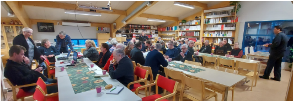
Teksti ja kuvat: Kai Kouvo

Kokouksen jälkeen vapaata keskustelua tulevan kesän tapahtumista mm. Classic Motorshowsta ja Rompemarkkinoista.