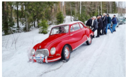
Uria väistellessä ojanpäälle aurattu tie olikin salakavala.

Lumisen talven merkit olivat vielä ihan käsin kosketeltavissa. Muutama kilometri ennen Petäjäveden lounaspaussia tien mutka muistutti talven aurauksista, tien reuna oli aurattu ojan päälle sillä seurauksella, mitä alla oleva kuva kertoo.