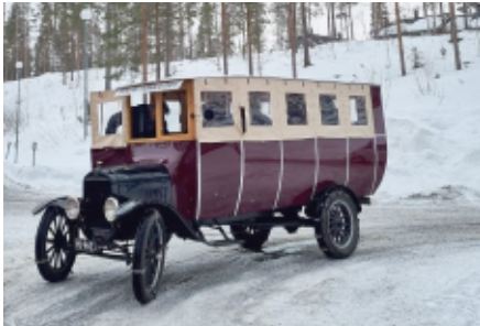
Ford linja-auto vuodelta 1924. Tämä auto toimi linjaliikenteessä Lieksassa 1920-luvulla

Hauska tapahtuma pitkästä ajasta. Järjestyksessään 48. talviajo oli sekä kaivattu että ehkä myös osittain unohdettu. Vuoden paussi ja epidemia näkyi osallistujamäärässä. Mukaan lähti kaikenkaikkiaan noin 130 autokuntaa. Vanhimmat autot lähtivät Petäjävedeltä muutaman kymmenen kilometrin matkalle kohti Keuruutaja hiukan uudemmat Laukaan Peurungan naapurista. Ilma ei sinänsä ollut kylmä mutta kostea tuuli sai sen tuntumaan poskipäissä.