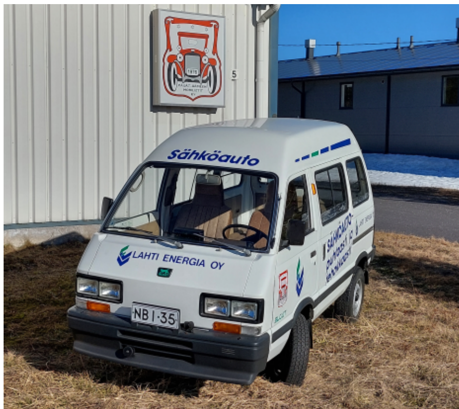
Elcat vihdoin museoajoneuvo

Suomen Ajoneuvohistoriallinen Keskusliitto ry:n jäsenkerho Päijät-Hämeen Mobilistit Ry