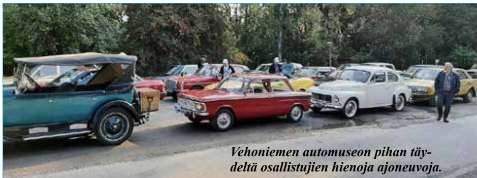
Vehoniemen automuseon pihan täydeltä osallistujien hienoja ajoneuvoja.

Lopuksi Kisarantaan Tampereen Mobilistien rompetorialueelle. Ajon päätteeksi jaettiin jollain hyvällä syyllä valittuja pieniä palkintoja ja nautittiin Jussilan Jommun keittämä keittolounas.