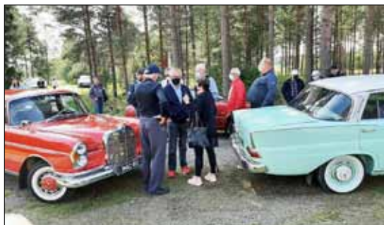
Osallistujat seurustelutauolla Varsamäen navetan pihamaalla. Huomiona osallistujien auto-merkeistä, 30 autosta 12 oli Mersuja.