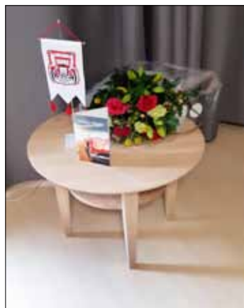
Onnittelukukat, standaaari ja kortti