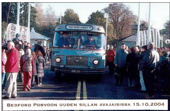
Bedford pääsi ajamaan ensimmäisenä sillan yli Porvoon kaupungin uudella sillalla 15.10.2004.