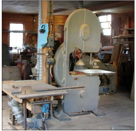
Vanesaha ja sirkkeli on vanhoja, mutta toimivat hyvin.

Linja-automuseo on Suomen Linja-autohistoriallisen Seuran kumppanina hankkeessa, jossa tehdään kokoelmasuunnitelma Suomen linja-autohistoriallisen museokokoelman perustamiseksi. Vanhimmat yhä toiminnassa olevat linja-autoryitykset ovat saavuttaneet tai saavuttamassa sadan toimintavuoden rajapyykin.