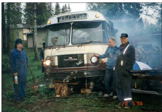
Ollaan hakemassa varaosa-autoa Meren Arviltä Kellokoskelta. Pitihän auto käyntiin panna, vähän savutti kylmänä.