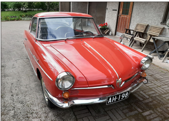
NSU Sport nyt

Acadian, Adler, Austin, Bedford, Borgward, Commer, DAF, De Soto, DKW, Fargo, Fordson, FSO (= Polski Fiat), Hanomag, Hillman, Hudson, Humber, IFA, International, Jowett, Leyland, Lloid, Magirus-Deuz, Mercury, Morris, Nash, Neckar, NSU, Oldsmobile, Packard, Panhard, Pontiac, Rambler, REO, Riley, Rover, Saab, Simca, Standard, Steyr-Puch, Studebaker, Sunbeam, Talbot, Teijo, Trabant, Triumph, Vanaja, Wartburg, Willys, Wolseleym Zastava, Zwickau