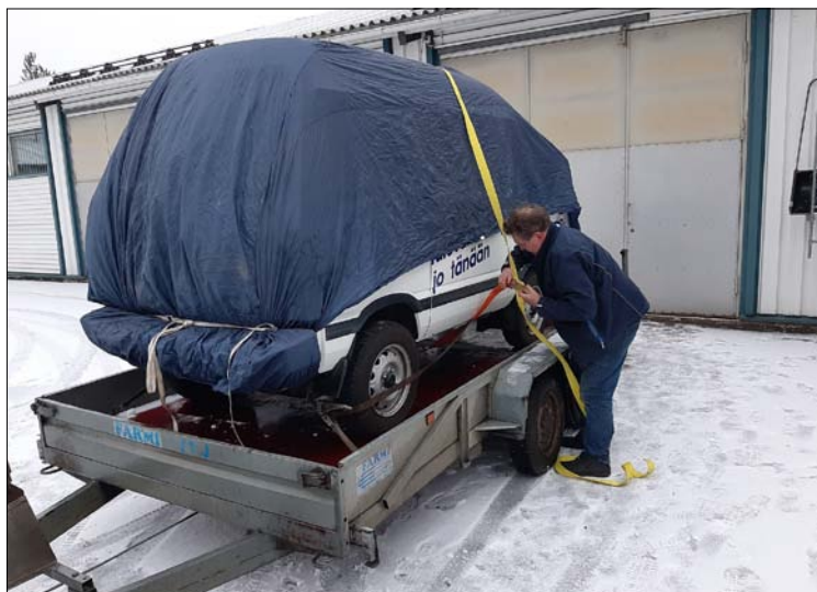
Menomatkalle katsastukseen Elcat paketoitiin hyvin, täytyihän vahattua autoa pitää katsastuskunnossa.