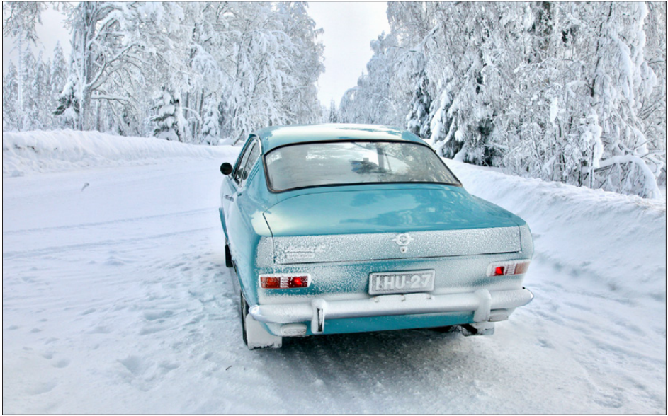
Talvista kuuraa peräpeilissä.

Keski-Suomen Mobilistien järjestämä Talviajo -tapahtuma kerää vuosittain lähes 200 ajoneuvokuntaa ajelemaan talvisissa maisemissa. Kotimaisten mobilistien lisäksi useat ruotsalaiset osallistujat ovat ottaneet ajon kohteekseen.