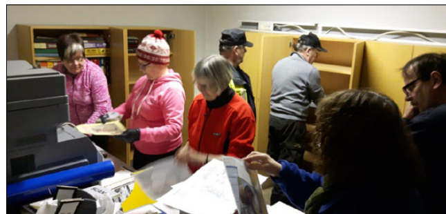
Kirjat kaapiin pikavauhtia, porukkaa oli riittävästi että saatiin vähän puhdittetuakin kirjoja.