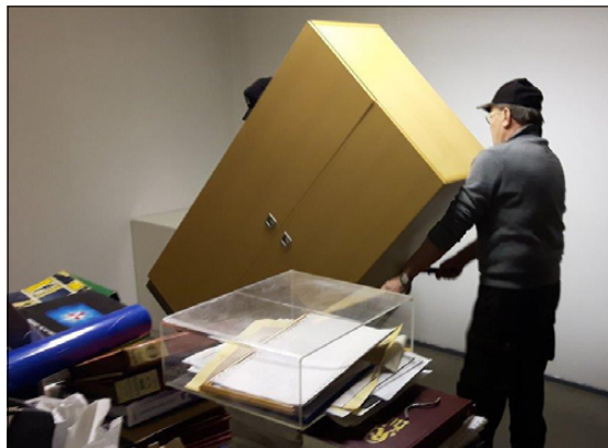
Hannu roudarasi kaapit nokkakärryllä sisään.

Kiitos kaikille hankkeeseen osallistuneille.