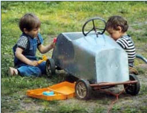
Uusi kiiltävä peltikorinen polkuauto huollossa.