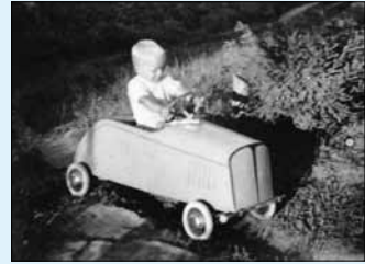
Polkuauton ensimmäinen kori.

Tällainen polkuauto valmistui 1950 luvun alussa. Auto oli silloin vanerikorinen, mutta kuten isotkin autot niin tämäkin piti uudelleen korittaa 70 luvulla seuraaville käyttäjilleen. Alkuperäisen vanerin tilalle tuli peltikuoret. Hyvinhän sitä on huollettu, kuten kuvassa näkyy huoltoajat hommissaan. Seuraavakin ikäryhmä on sillä kurvailut 80 - 90 lukujen vaihteessa. Tämä polkuauto on vieläkin tallessa ”mummolassa”.