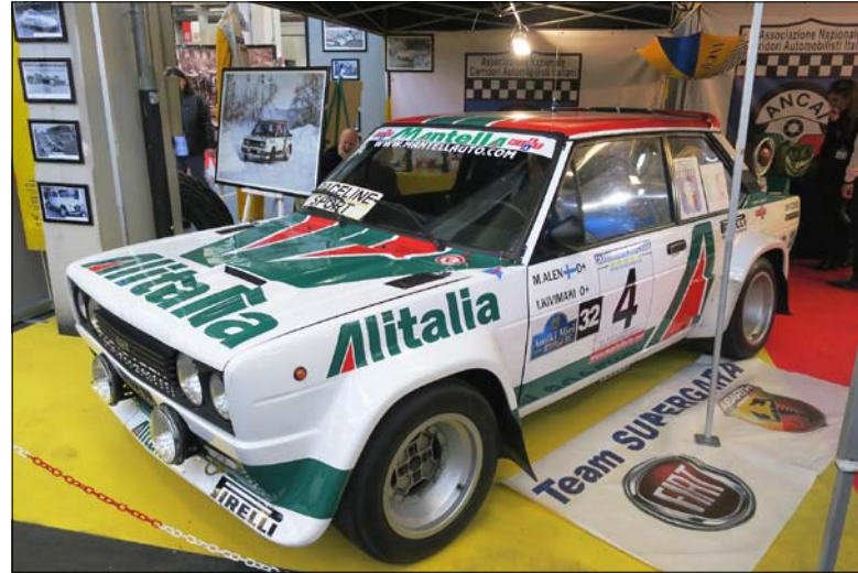
Markku Alen on suosittu mies Italiassa vieläkin. Fiat 131 on replica Alenin aktiivikilpauran ajalta.

Kolmannen päivän aamuna mentiin tutustumaan Italian kansallisen automuseon antiin. Museosta löytyy kaikkea tekniikasta taiteeseen, ja nähtävää on paljon. Nimestä huolimatta esillä on paljon muitakin kuin italialaisia autoja. Näyttillä on ajoneuvoja kanttiautosta nykyaikaan, kaikenlaisia eri maissa valmistettuja klassikkoautoja hienosti esille aseteltuna.