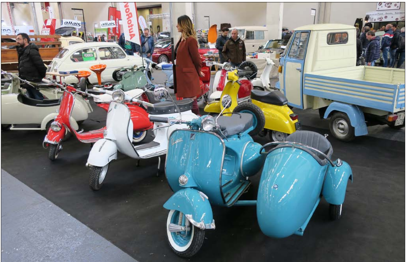
Italialainen kansalliskulkuneuvo oli itseoikeutetusti esillä monella osastolla.

helle messukeskusta. Fiatin vanha, vuonna 1923 valmistunut 5-kerroksinen Lingoton autotehdas on aivan messualueen vieressä. Tehdas on suljettu vuonna 1982 ja avattu 1987 uudelleen 8-Gallery kauppakeskuksena. Tehtaan katolla on edelleen kilometrin mittainen koe-