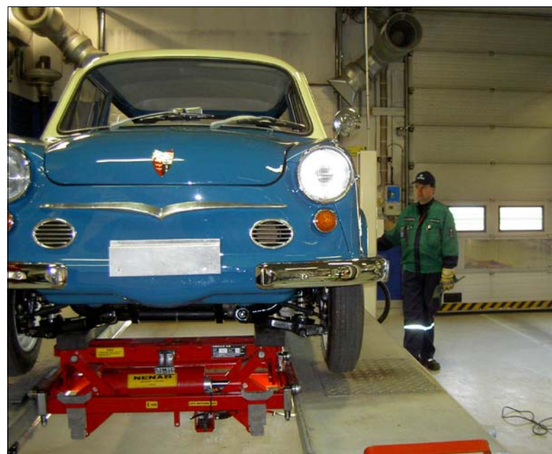
Museoauton katsastus A-Katsastuksen tiloissa Lahden Renkomäessä.

Katsastusten lisäksi työhön kuului myös taksamitareiden tarkastus, ns. maaseutumatkat ja ajoneuvojen kelpoisuuden arviointi SA-käyttöön sekä kuljettajatutkinnot.