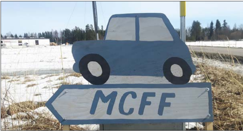
Ajo-ohjeesta ei Mini-harrastaja voinut erehtyä.