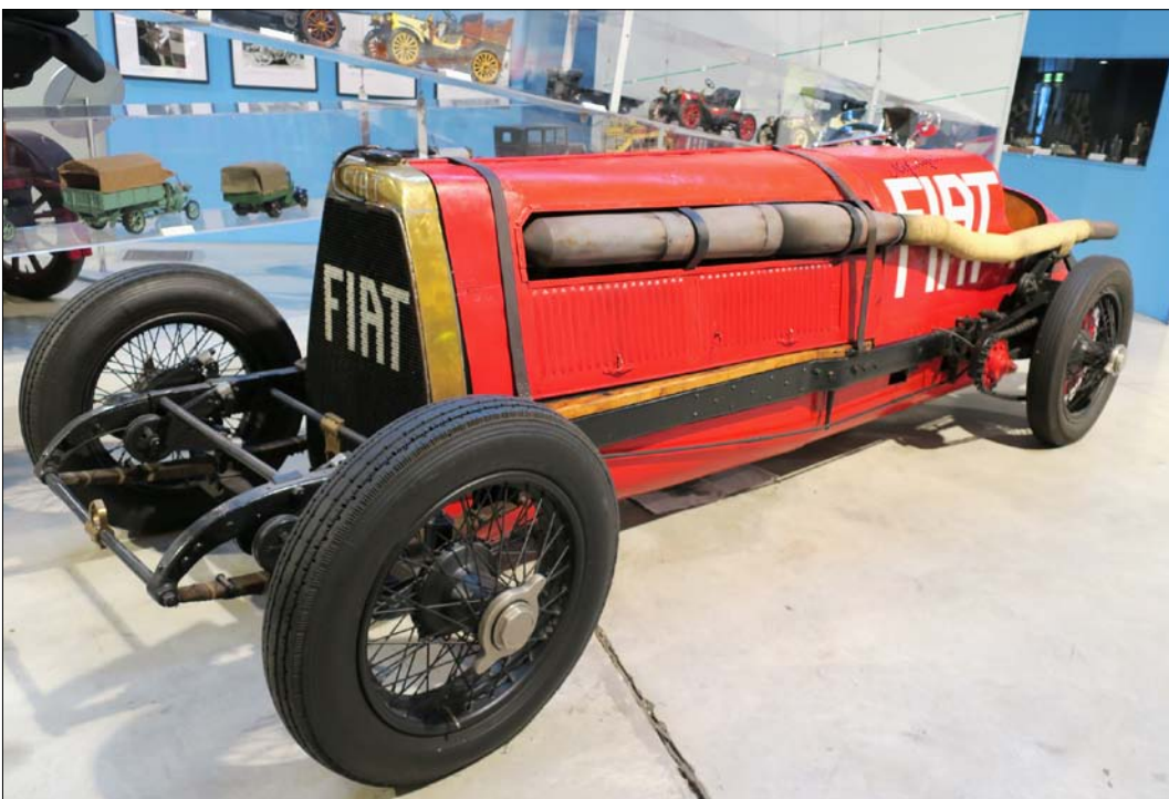
Vuonna 1908 valmistettu Fiat Mefistofele saavutti nopeusennätyksen 235km/h vuonna 1924. Tekniikkaa uusimalla autoon saatiin miehekät lukemat: 320hv/1800rpm.

Sunnuntaiaamuna pakattiin laukut ja aamupalan jälkeen ajeltiin vielä Fiatin tehtaan museolle joka on avoinna ainoastaan sunnuntaisin - ja vielä veloitus-