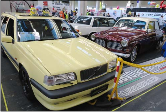
Club Volvo Italian osastolla oli esillä tuoreempaakin klassikkokalustoa.

ajorata ja se piti tottakai nähdä ennen messuille menoa - eikä käynti ollut turha, kyllä oli aika vaikuttava näky maisemineen ja kallistettuine päätykaarteineen.