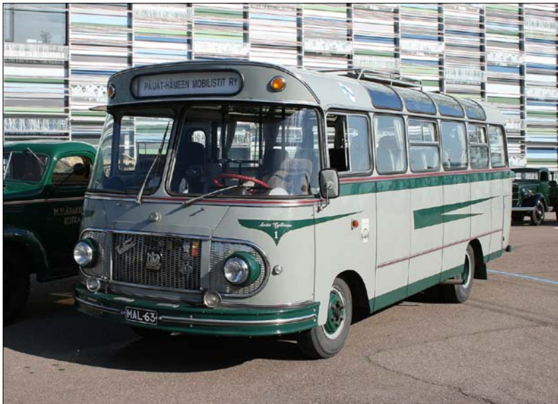
Kerhon "Petteri" Kotkassa 10.6. 2017