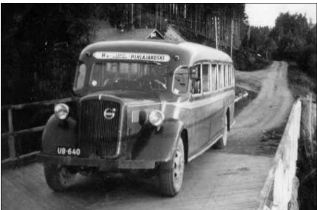
Bussi numero 9 (U-1640) oli Volvo B22 vuodelta 1938. Auto sai SA-kilvet ja oli sotatoimissa. Ei ole tietoa auton vaiheista, kuinka paljon sitä jouduttiin korjaamaan sodan jälkeen, mutta merkintää uudesta korista ei ole. Bussi UB-640 poistettiin rekisteristä 1955.

Sotien jälkeen vuosina 1946 -50 linja-autojen tuontialustoja oli vaikea saada. Sisu oli suomalainen, mutta senkin tuotannossa kuorma-autot olivat etusijalla, sillä puutavaran ja paperin viennistä saatiin haluttua valuuttaa. Kuorma-autoilla saatiin puu metsästä teollisuuden käyttöön ja edelleen tehtaalta satamiin.