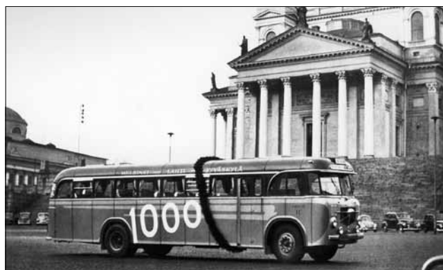
Oy Autokorirakenne Ab (Kutter) vietti syyskuussa 1953 tuhannen valmistuneen linja-auton korin juhlia. Linjaliike Rajalan numero 14 oli seppelöity ja kylkeen maalattu suurin numeroin 1000.