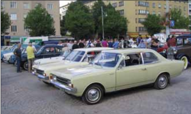
Opel Kapitän Lahden torilla kesällä 2005

PSA-konsernin tulos ollut viime vuodet niukasti positiivinen. Kauppaan kuuluu merkit ja 12 tehdasta, mutta ei Opelin patenteja. Kauppahintaa 2,2 mrd € pidetään halpana