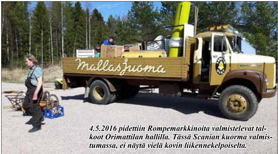
4.5.2016 pidettiin Rompemarkkinoita valmistelevat talkoot Orimattilan hallilla. Tässä Scanian kuorma valmistumassa, ei näytty vielä kovin liikennekelpoiselta.

Rompemarkkinat pidettiin 14-15.05. 2016 kuudetta kertaa Jokimaan raviradalla. Valmisteluihin saatiin kohtuullisesti talkoolaisia ja työt tulivat tehtyä pienten sateiden saattelemana.