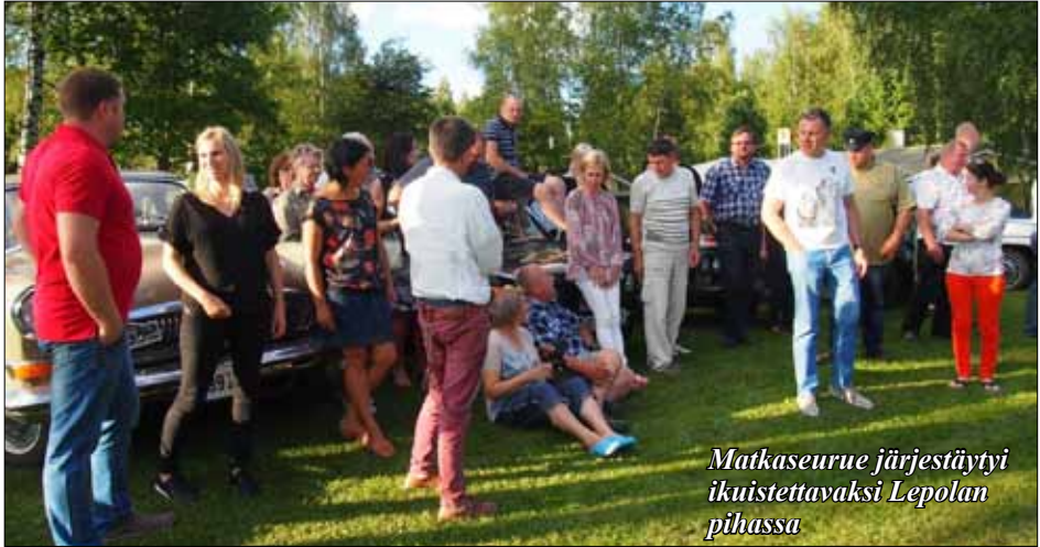
Matkaseurue järjestäytyi ikuistettavaksi Lepolan pihassa

Virolaiset valmistelivat matkaa jo talvel-la. He tekivät koematkan kolmeen mie-heen, vierailen mm. Orimattilan hallilla 21.4.2016.