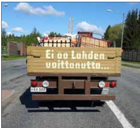
11.5.2016 keskiviikkona, matkalla Jokimaalle, Rompemarkkinakuorma näytti tällaiselta.

Rompemarkkinat pidettiin 14-15.05. 2016 kuudetta kertaa Jokimaan raviradalla. Valmisteluihin saatiin kohtuullisesti talkoolaisia ja työt tulivat tehtyä pienten sateiden saattelemana.