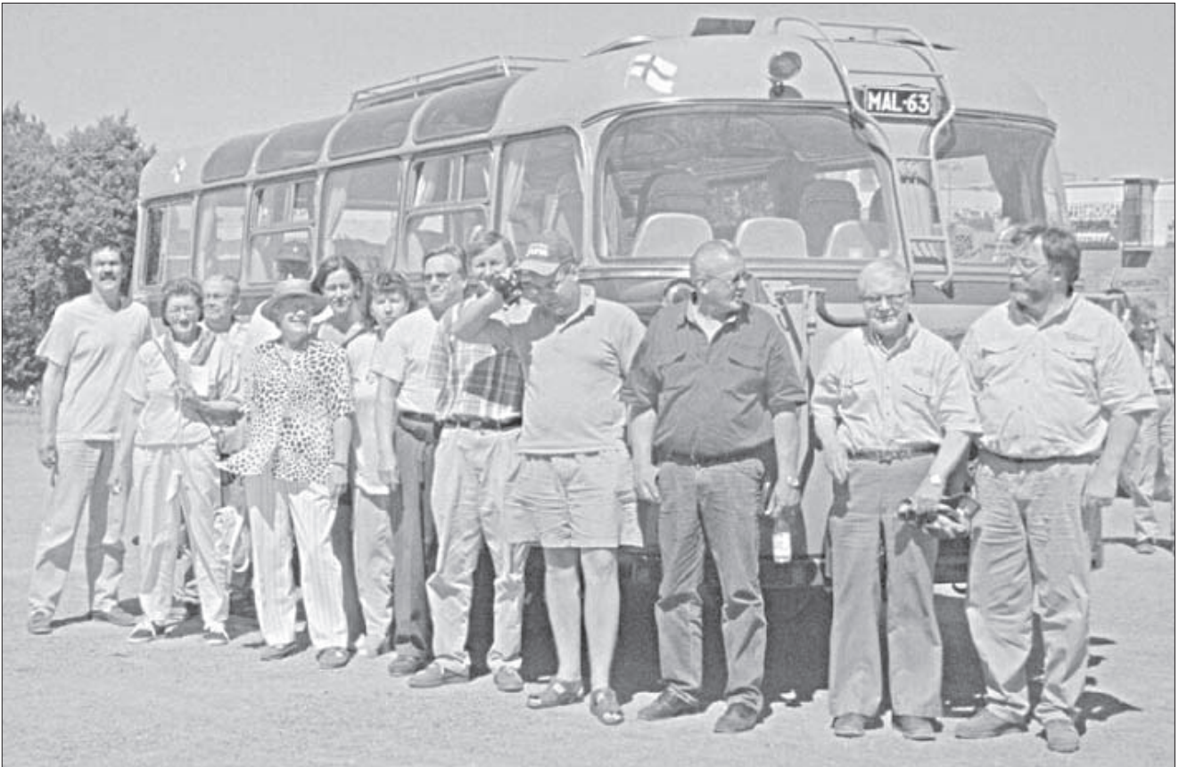
Bedfordin kyydissä juhla-ajoissa mukana olleet yhteiskuvassa.