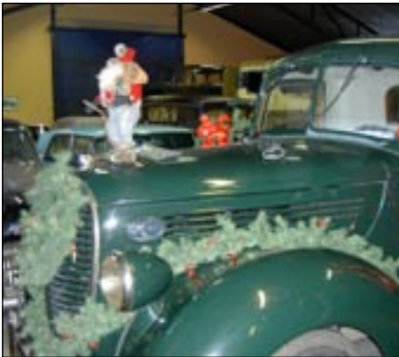
Lucia-ajoon koristeltu MOI-1

13.12. Kerhon MOI-1 Lucia-neito tapahtumassa Helsingissä