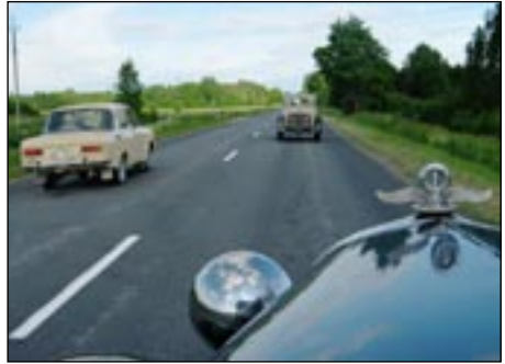
Kaikkea sitä joutuu reissullansa kokemaan. (Kuvattu Karin autosta)

Ehkä uudemmalla kalustolla oli helpompi pysyä aikataulussa. Ajo kartan ohjeiden mukaan vaikutti hieman vaikealta, ja ilmeisen paljon porukka etsikin oikeaa reittiä. Erityisen hyvänä pidin etapin välissä olevaa noin kahden tunnin taukoa, sekä selkeällä aikataululla etenevää ajoa. Ralli päättyi Pärnuun vasta illankoitteessa, joten koko päivä hurautti mukavasti harrastuksesta nauttien. Ilmaisen lounaan lisäksi Laitse Rally Parkissa ajettiin vapaaehtoinen nopeuskilpailu rallipuiston rallycross radalla. Lisäpisteitä sai sitä enemmän,