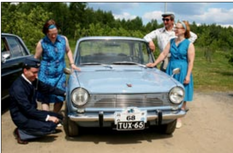
Simcan katsastus Saimaalla

60-70 luvun vaihteessa, ja tuloksena oli ammattilaisten sarjan (aiemmin palkitut) ykkössija.