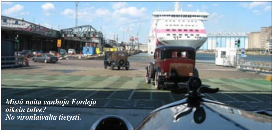
Mistä noita vanhoja Fordeja oikein tulee? No vironlaivalta tietysti.