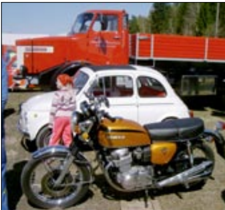
Tämän vuoden apurahan saaneet ajoneuvot, Sisu, Fiat ja Honda.