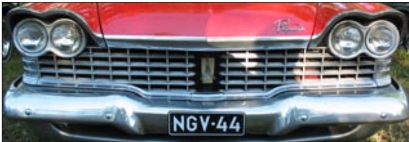
Dollarihymy - ehkä useammankin dollarin. Kuva Vääksyn tapahtumasta 2008

Rauhallista ja hyvää Joulua sekä toiminnallista Uutta Vuotta toivoo Esa.