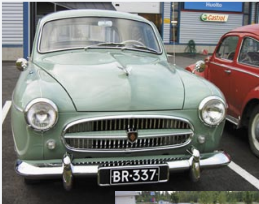
RENAULT LA FREGATE 4D SEDAN R- 1103/2800 Vm. 1957.

Päijät-Hämeen Mobilistit Ry:n jäsenlehti