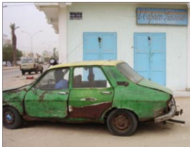
Tässä on auton loppuunkäytöstä vähän afrikan mallia, ei jouda entisöintiin vielä pitkään aikaan.

Nettipäiväkirjaa matkan aikana ylläpiti Pena pääasiassa puhelimitse saatujen tiedonjyvästen pohjalta.