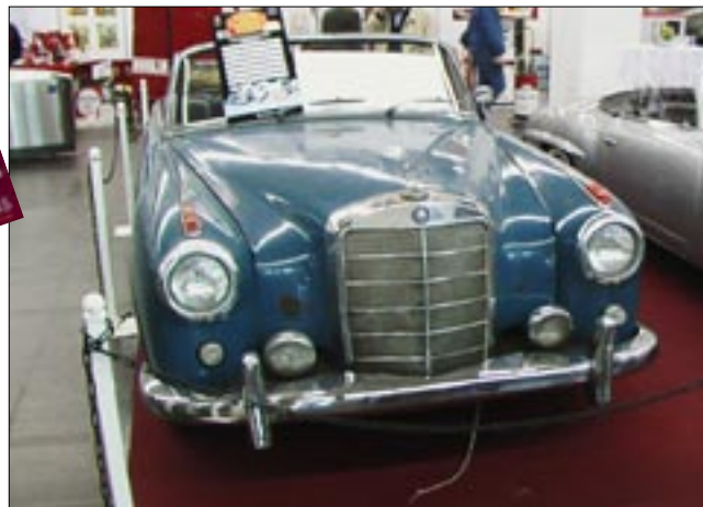
Tämä Mersun Capriolet 220 S 1958 maksoi 24500 euroa.

hes keskustassa havaitun pienen hotellikyltin ovea kolistelemaan ja heti täppäsi hyvä ja edullinen majoitus, mutta vain yhdeksi yöksi. Alakerran baarissa iloinen baarimikko tarjosi talon puolesta yömyssyjä ja sitten nukkumaan. Aamulla huomattiin että messuhallit olivat muutaman sadan metrin päässä, harmi vaan kun ei saatu jäädä seuraaviksi öiksi.