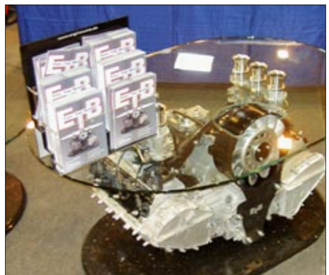
Kaikilla itseään kunnioittavilla Porsche miehillä pitää olla olohuoneessa tällainen pöytä.

Liikenne ohjattiin pienelle kiertotielle ja se jumiutui täysin. Onneksi meillä oli mukana gbs-suunnistus käytettävissä, tietokone esiin ja uutta reittiä katselemaan. Tehtiin uusi matkasuunnitelma ja poistuttiin ruuhkasta pikkuteitä, 16 kilometrin ajelun jälkeen oltiin E1-tiellä nokka kohti Bremeniä, ruuhkassa meni aikaa n. 40 minuuttia. Ruuhkasta päästyämme ajo Tanskan rajalle sujui yli 160 km keskinopeudella, suoraan sanoen tämä nopeus on näillä ajokokemuksilla liian kova, mutta moottoritie oli tähän aikaan aika vähäliikenteinen. Tanskaan päätettiin ajaa tietä Ison-Beltin sillan ja Odensen kautta, sielläkin on komeita siltoja katseltavana ja aikaa menee saman verran kuin lauttareitilläkin, siltaylitys maksoi 250 kr. Puolelta yöltä oltiin Malmön pohjoispuolella Scandic-hotellissa josta löytyi yösiija. Taas tultiin silta-tunneli reittiä pitkin Ruotsin puolelle. Matkaa kertyi noin 900 kilometriä kaikkineen mutkineen.