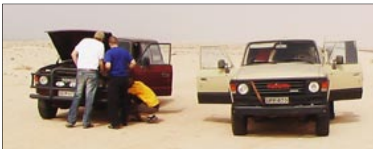
Tässä malinmatkajien Toyotat huoltotarkastuksessa jossain Saharassa.

Kotinurkista mukaan oli haalittu kaikki vanhat "niitokoneen" työkalut ja sokeripihdit, työkaluja kun ei pystynyt tuomaan takaisin paluulennolla. Hyvinhän ne isoisien perintötyökalut riittivät ja jatkavat nyt perinteitä jossain Afrikassa.