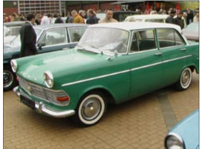
Ulkoalueella myynnissä ollut 1963 Opel maksoi 1900 euroa.

Paluumatkalle lähdettiin lauantaina n. klo 17:00 tarkoituksena ajaa E2 Hannoverin kautta Ruotsiin yöksi. Heti alkuunsa jouduttiin isoon ruuhkaan joka aiheutui tietyömaan takia suljetusta moottoritiestä. Tämän olisi varmaan välttänyt jos olisi pystynyt kuuntelemaan liikennetiedotuksia paikallisista radiolähetyksistä.