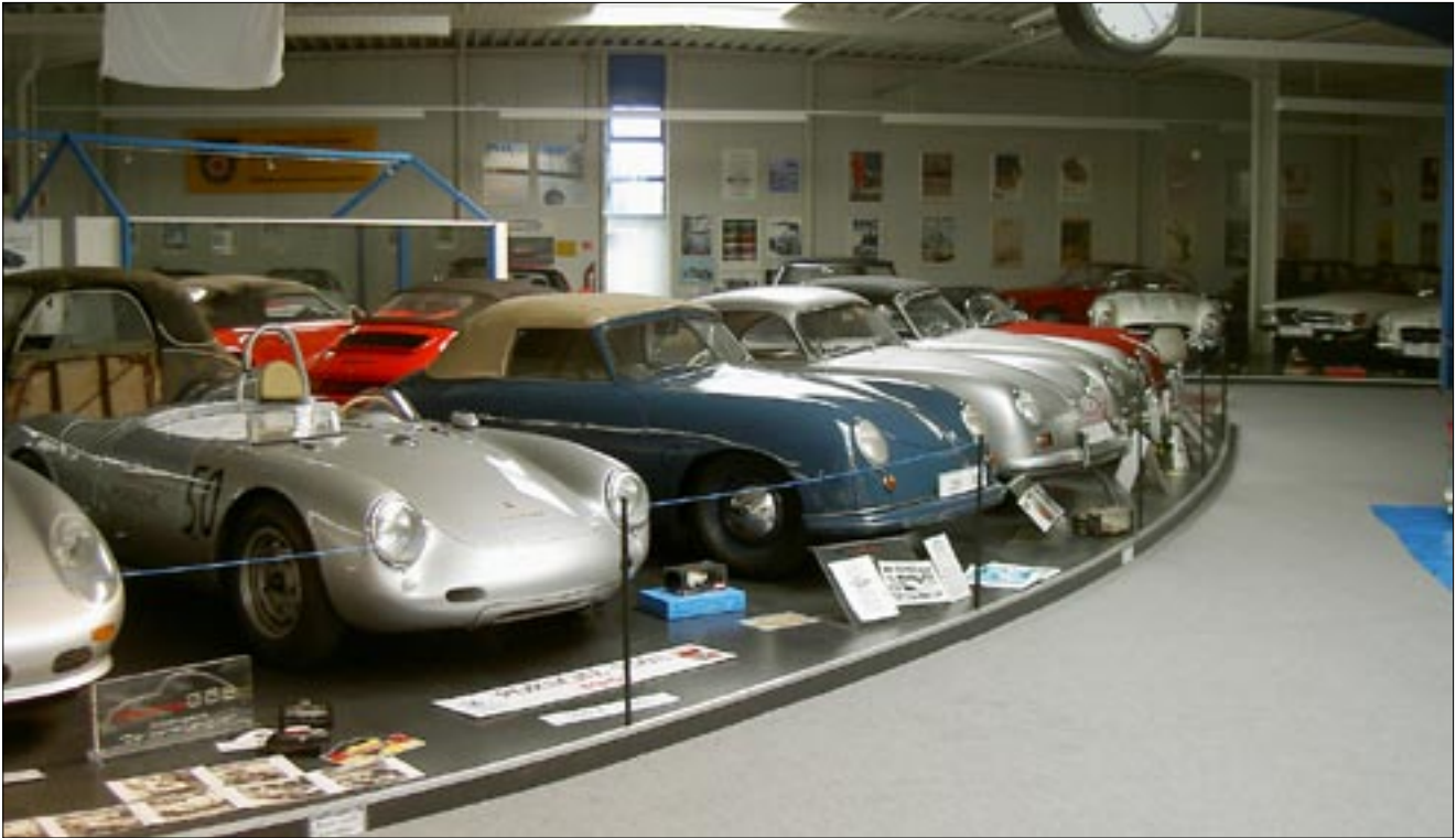
Yleisnäkymä D.Kleine Lemgoer automuseosta Lemgosta, Porscheja riittää.

Walterilta saatiin lähes kaikki osat mitä oli tilattukin, ja vähän heräteostoksiakin tuli tehtyä. Nykyisen projektini III-Prinzin osia kyllä jäi vähän uupumaan.