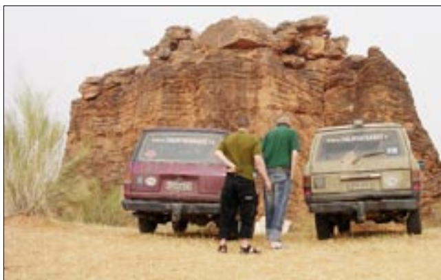
Matkaajat tauolla ihmettelemässä Saharan ihmeitä.

Vanhat n. puoli miljoonaa kilometriä ajatut Toyotat kestivät tämän öljynvaihtovälin mittaisen safarin pienillä ylläpitoremonteilla. Ennen lähtöä oli tehty vain normaalit öljynvaihtohuollot sekä vähän varustautumista mm. lisäpolttoainetankeilla ja vararenkailla. Matkalla jouduttiin tekemään vuotavan kytkimen pääsylinterin remppa sekä korjaamaan katkennut jarruputki. Lisäksi meni muutama rengas, mukana olleista kuudesta vararenkaasta jäi vielä tähteeksikin. Perille päästyä toisen Toyotan vaihdelaatikko oli tiensä päässä, onneksi kesti juuri ja juuri Bamakoon saakka, ja jäihän siihen toiseenkin autoon vähän vajaat jarrut kun matkakorjaustekniikka oli vaan tukkinut katkenneen putken.