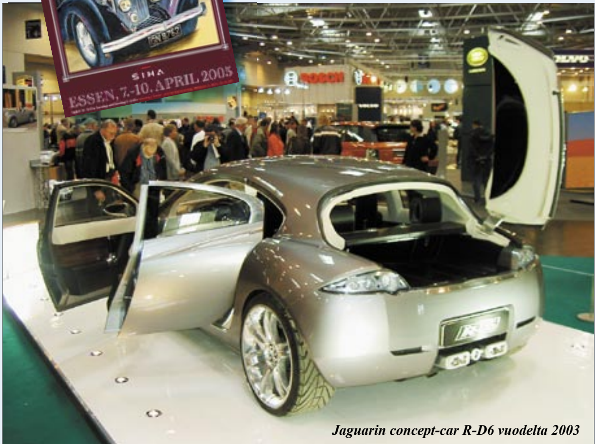
Jaguarin concept-car R-D6 vuodelta 2003