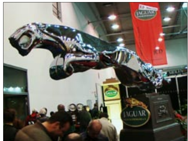
Jaguar-osastolla oli komea ja varmasti näkyvä Jaguar-sympoli.