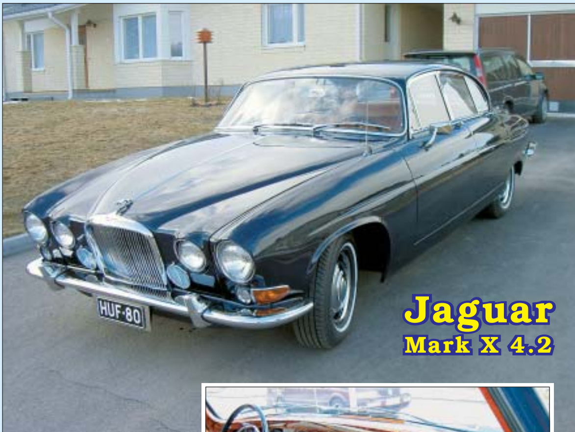
Jaguar Mark X 4.2

Päijät-Hämeen Mobilistit Ry:n jäsenlehti