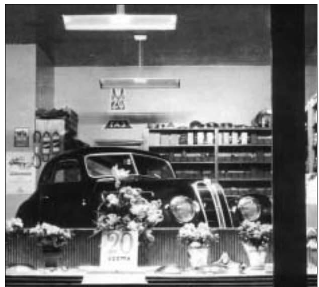
Näyteikkunasta otetusta kuvassa näkyy BMW 321, jonka sisarmallit 327 Cabriolet ja Coupé ovat nyt haluttua keräilytavaraa.