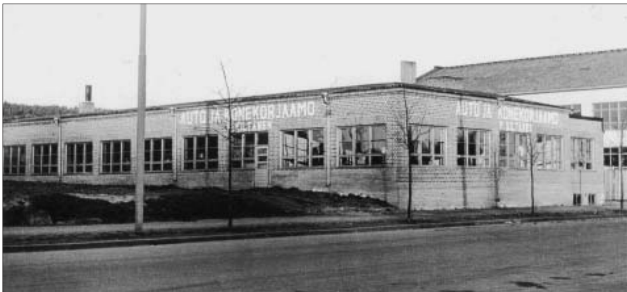
Lahden korjaamon ensivaihe Vesijärvenkadulla

- autot: Alfa-Romeo, BMW/EMW, Citroen (huolto), Ducato, Fiat, GAZ , Jalta, Lada, Lancia, MAZ, Moskvits, Pobeda, Renault, UAZ, Tatrplan, Toyota (huolto), Vanaja, Volga, Zil, ZIS, Suzuki varaosat ja huolto