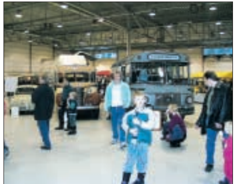
MalliExpossa syksyllä 2002