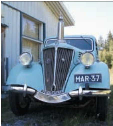
Hakulisen Onni sai "vuoden kaunein Renault-palkinnon" vuonna 2002

Kaikkiaan P-H Kerho on tarkastanut 767 ajoneuvoa museorekisteriin. Kerhon tarkastukset on talletettu ATK:lle.