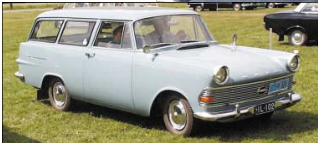
Antti Vähälän Opel Delivery Van, vm -61