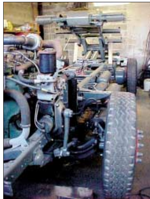
Kuvissa tämän hetkinen tilanne Eirasen tallissa

Taas on ahkerat talkoolaiset ahertaneet Orimattilan hallilla. Pitkin talvea, aina torstaisin, on Bedfordiamme kohenneltu katsastusta varten. Isohkon kunnostuksen tarpeessa ovat olleet takajarrut koska stefa oli päässyt vuotamaan öljyä jarrunauhoihin. Myös etupyörän laakerit on vaihdettu ja käsijarrua kohenneltu. Lisäksi paljon kaikesta pienistä nurkkien järjestelyä ja hallin hyllyjen siivousta ovat talkoolaisemme saaneet aikaan.