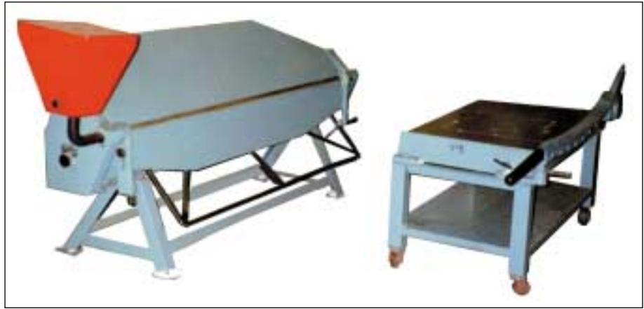
Vas. kanttikone ja oik. leikkuri.

Kerho on hankkinut Orimattilan hallille ammattitasoisia levynkäsittelykoneita. Meille tuli tilaisuus ostaa ystävällisellä hinnalla kanttikone ja peltileikkuri kun eräs alan yritys lopetti toimintansa. Kantti on työleveydeltään 2 metriä. Kaupantekijäistä saatiin historiallinen valurautarunkoinen pylväsporakone josta kätevät miehet tekevät vielä toimivan pelin. Pylväsporakone kaippaa 1 istukkaa jos jollain sattuu olemaan ylimääräinen.