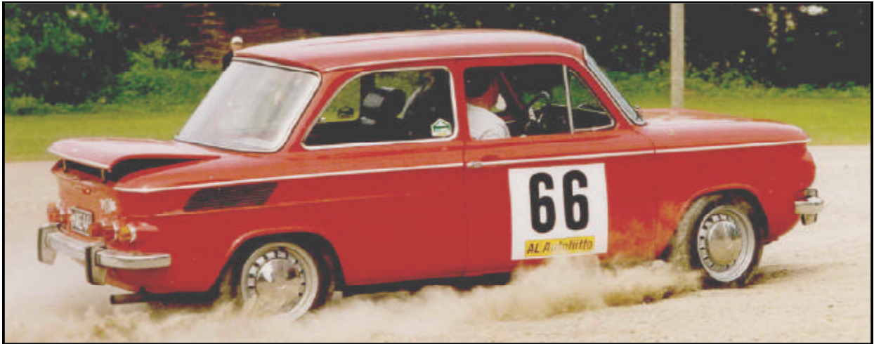
NSU TTS erikoiskoetta kaartamassa.