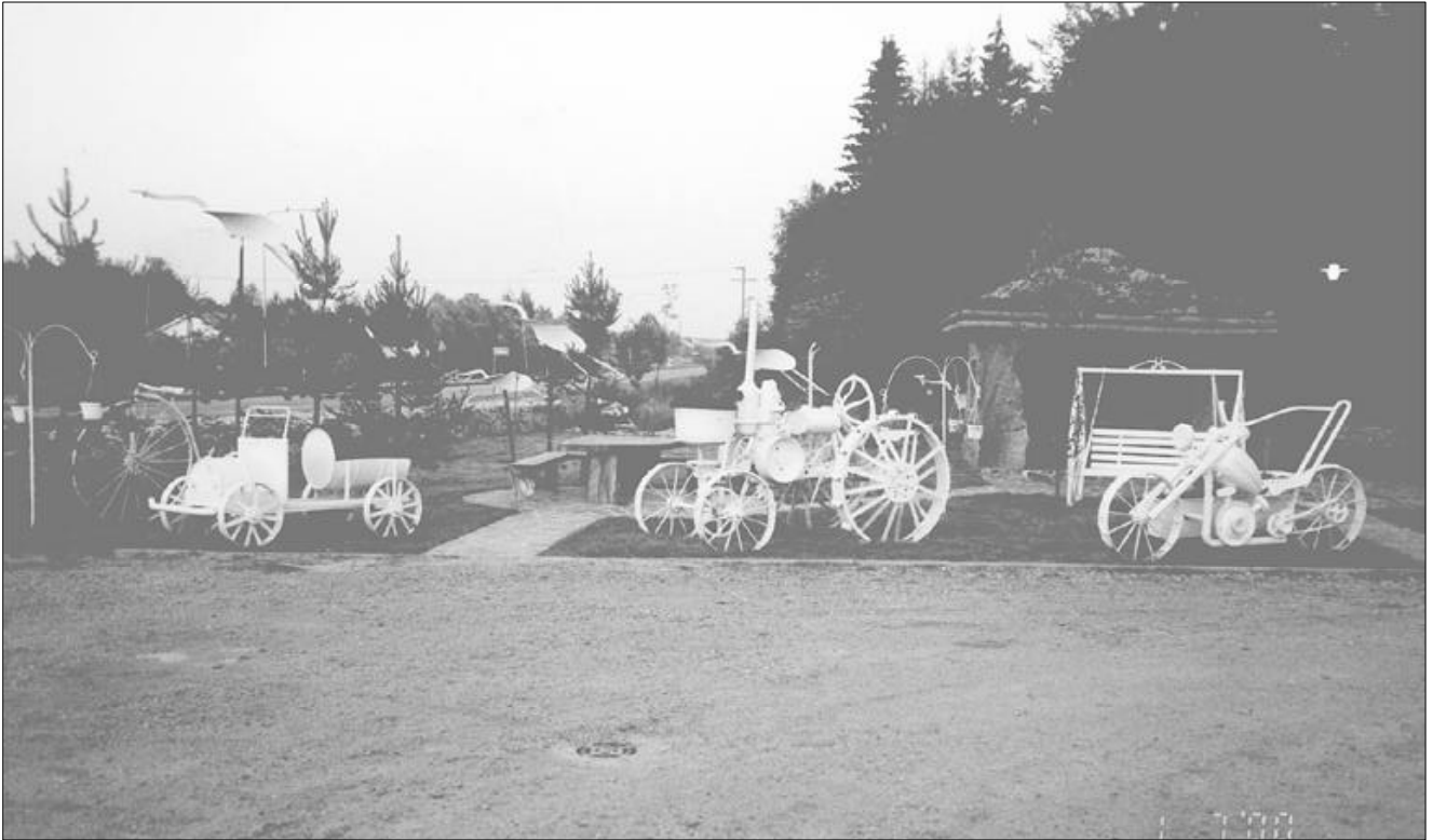
Kansantaiteen museo jossakin matkan varrella.

poimussa Mobiloil-haalariasuun pukeutuneet henkilöt kysyivät Suomen eniten myytyä öljymerkkiä. Tosin silläkin rastilla piti miettiä, josko siinä piili kompa, eli väärä vihje.