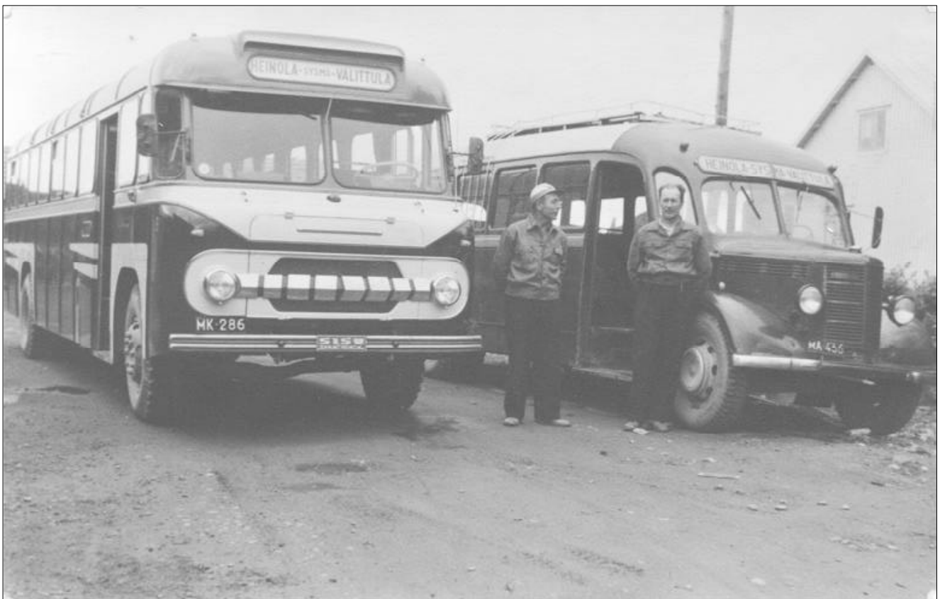
Järvisen Liikenteen linja-autoja ehkä 50-luvulla. Liekö linjalle tullut uusi auto.