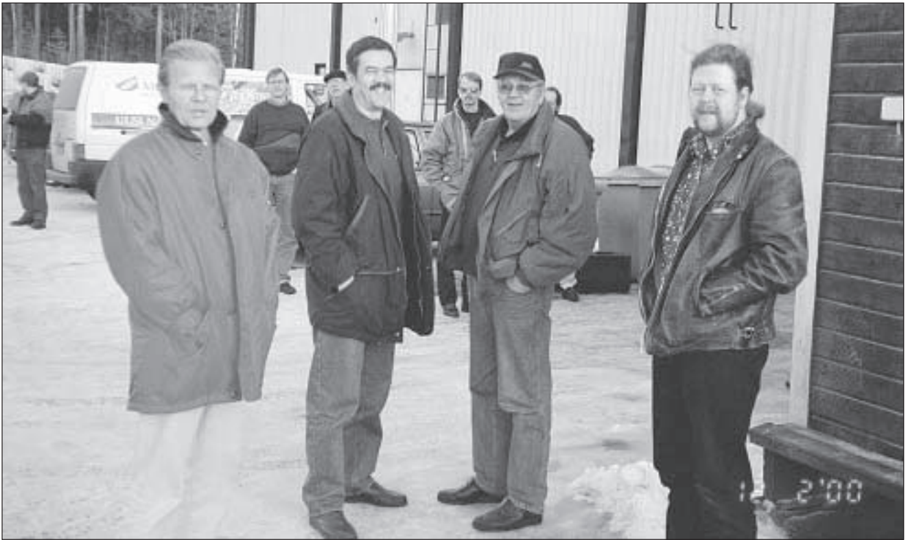
Ryhmä poseeraa Muotoiluinstituutin entistämispajan edustalla. Hymy on vielä herässä