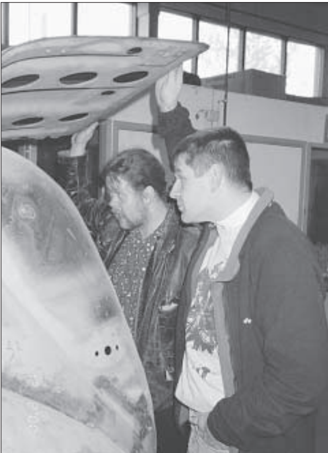
Onks täällä ketään?

Kerhomme jäsenet osallistuivat seminaariin voimalla seitsemän miehen. Seminaari pidettiin Kouvolan Muotoiluinstituutin autoentistämislínjan järjestelmänä ja kouluun tiloissa. Ohjelmasisällöstä poimitua: